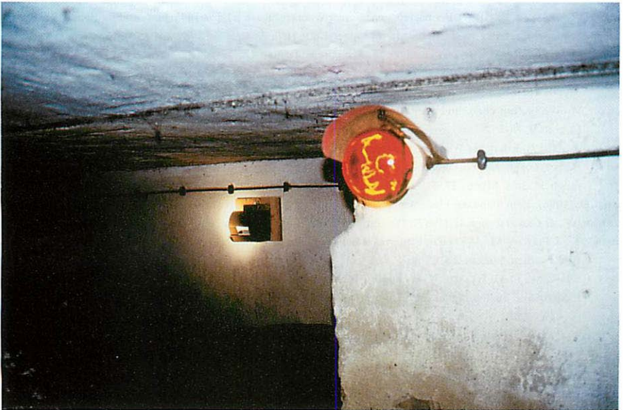
Abb. 1. Position des Plastehalterungskastens an der Kellerwand.

Auf den Bildern ist zu erkennen, daß der „Kasten“ dicht unter der Kellerdecke (ca. 1,80 m hoch) befestigt ist (Abb. 1). Der Innenraum des Behältnisses ist so knapp bemessen, daß das Tier - ein Graues Langohr ( Plecotus austriacus ) - sich zwar oben am kleinen Styropur-Block anhängen kann, aber unten mit der Schnauze und den Ohrdeckeln noch herauschaut (Abb. 2). Wenn man den Deckel des „Kastens“ anhebt, kann man die genaue Hangposition des Tieres sehen (Abb. 3). Damit es, wenn der Keller betreten werden muß, der Fledermaus beim Einschalten des Lichtes nicht zu hell im Raum wird, hat der Besitzer eine rote Glühbirne eingeschraubt (Abb. 1)!