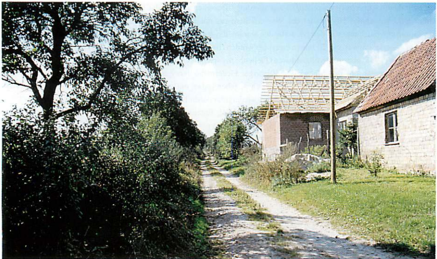
Abb. 1. Jagdhabitat der Wasserfledermaus.

Am Sonntag, dem 30.X.1994, beobachtete ich um 16.00 Uhr, noch am helllichten Tage, eine offensichtlich jagend in einer Pflaumenallee auf- und abfliegende Fledermaus. Über den Jagderfolg können keine Aussagen gemacht werden. Die Flughöhe lag im Durchschnitt bei 3 m.