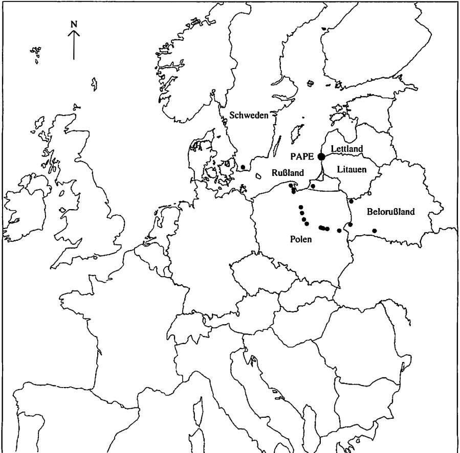
Abb. 1. Fundorte des Mausohrs, Myotis myotis , im nordöstlichen Teil des Verbreitungsgebietes unter Berücksichtigung der Angaben nach GERELL & LUNDBERG (1985), KURSKOV (1981), RUPRECHT (1983) und RYBERG (1947).

Nicht verschwiegen werden sollte in diesem Zusammenhang aber auch, daß mehrere Naturforscher des 19. und des beginnenden 20. Jahrhunderts das Mausohr unter dem wissenschaftlichen Namen Vespertilio myotis der Fauna Lettlands zuordneten. Erst als KARL KUPFFER (1937) eine sorgfältige Revision der Fledermausbelege lettischer Museen und Sammlungen vornahm und die Art nicht fand (aber viele falsch bestimmte Tiere), wurde sie in der faunistischen Literatur Lettlands nicht mehr erwähnt. KUPFFER schloß aus seinen Recherchen, daß die Naturforscher früherer Jahre schlechte Fledermauskenner waren und andere Arten für „ Vespertilio myotis “ gehalten hatten.