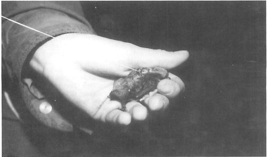
Abb. 1. Wasserfledermaus mit aufgeklebtem Sender.

Die Befestigung des Senders an der Fledermaus kann grundsätzlich entweder mit einem Halsband oder durch einfaches Festkleben im Nackenfell erreicht werden. Im Versuch Nr. 1 fand ein selbst gefertigtes Halsband aus dünner Kunststoffolie Verwendung, in das eine Sollbruchstelle aus Blumenbast eingearbeitet war. FUHRMANN (1991) berichtet über positive Erfahrungen mit solchen Halsbändern. Das Halsband muß, um nicht abzurutschen, den Hals fest umschließen. Wird das Halsband zu fest gezogen, könnten Nahrungsaufnahme oder Atmung behindert werden. Wegen dieser Problematik wurde in den hier beschriebenen Versuchen Nr. 2 bis 4 der Sender ohne Halsband mit Sekundenkleber direkt ins Nackenfell geklebt. Dies hat allerdings den Nachteil, daß die so befestigten Sender bereits nach einigen Tagen wieder abfallen, lange bevor die Batterie erschöpft ist, und daß sehr darauf geachtet werden muß, daß die Haut der Fledermaus nicht mit dem Klebstoff in Berührung kommt.