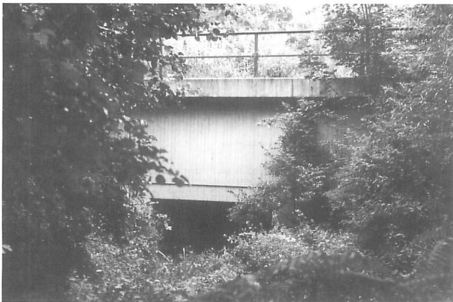
Abb. 4. Unterführung des Wambachs unter der Autobahn A3 am Entenfang, Aufn.: C. EBENAU

Durch die telemetrischen Untersuchungen, die zeitlich unmittelbar nach der Zeit der Jungenaufzucht durchgeführt wurden, konnten sechs Baumquartiere gefunden werden, die einer Wochenstubenkolonie der Wasserfledermaus zuzuordnen sind.