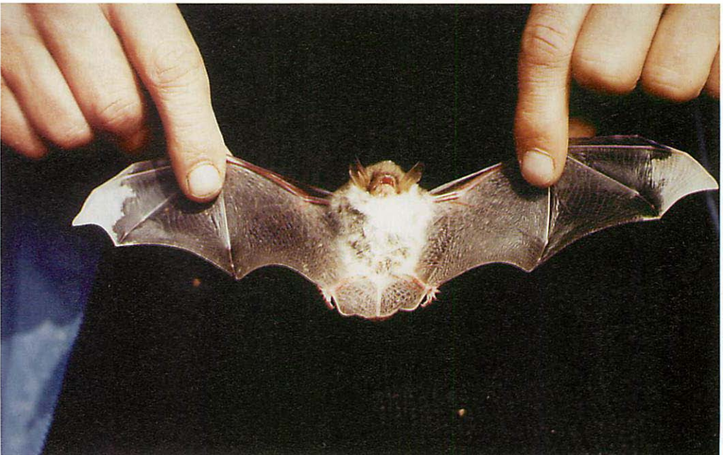
Abb. 2. Partiell-albinotische Fransenfledermaus ( Myotis nattereri ) aus dem Raum Rodewald/Niedersachsen (ventral).

Insgesamt wurde Myotis nattereri 1993 im Kreis Nienburg/Weser als häufigste Fledermausart in den Nistgeräten angetroffen. In den von mir intensiv betreuten Gebieten um Rodewald waren damals etwa 17 Ind. (rund 11% aller hier nachgewiesenen Fledermäuse) notiert worden. Es fanden sich häufiger Braune Langohren ( Plecotus auritus ), Bechsteinfledermäuse ( Myotis bechsteini ) und Bartfledermä-