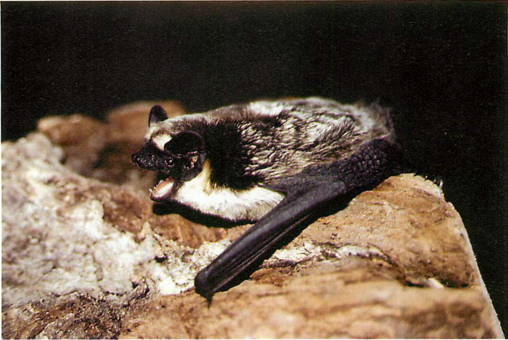
Abb. 1. Ad. Zweifarbfledermaus- \sigma ( Vespertilio murinus ) am 7.VII.1995, August-Bebel-Straße 7. Graal-Müritz.

chenstube Graal-Müritz wird die Existenz eines \sigma -Sommerquartiers und damit eine mögliche Paarung vor Ort vermutet.