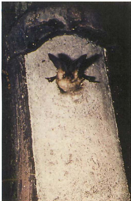
Abb. 1. Braunes Langohr verläßt eine fledermausfreundliche, da mit Hohlraum über dem Flugloch ausgestattete, Holzbetonhöhle für Höhlenbrüter (Typ: 2M) der Fa. SCHWEGLER.

betonhöhlen antreffen. Bis auf ganz vereinzelte Fälle, bei denen leicht abgeschliffene Daumenkrallen erkannt wurden, konnten wir keine allgemeinen Abnutzungen bei den Abendseglern feststellen.