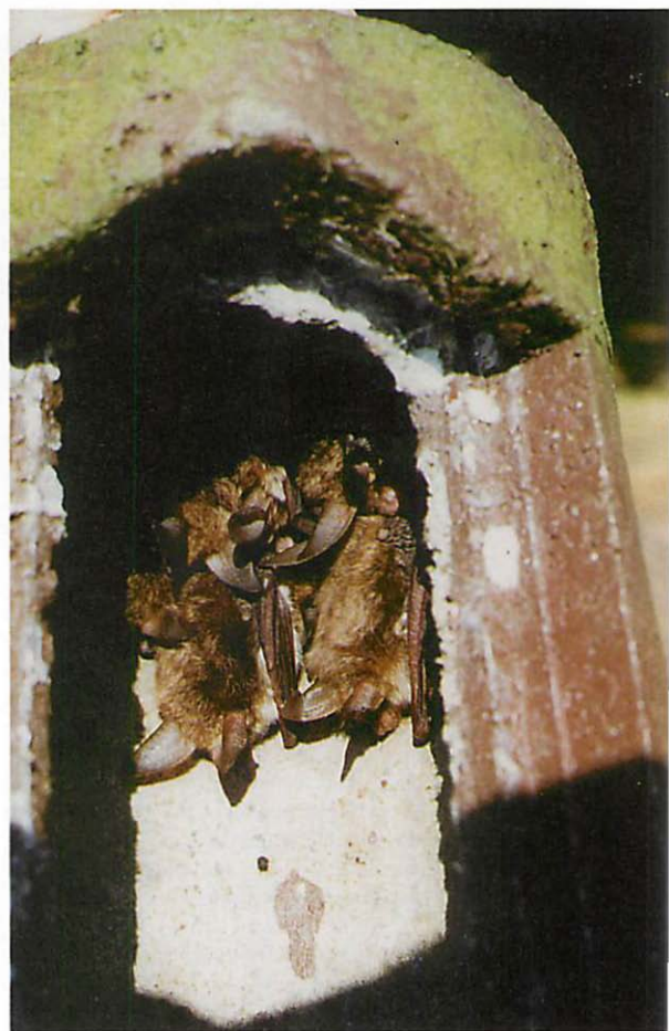
Abb. 2. Kolonie der Bechsteinfledermaus in einer Fledermaus-Holzbetonhöhle (Typ: 2F mit doppelter Vorderwand) der Fa. SCHWEGLER. 2. IX. 1995 bei Rodewald (Kr. Nienburg/Weser)

mehr in den Monaten November bis Januar aufgesucht. In den letzten Jahren mit beinahe durchweg milden Wintern haben wir Abendsegler in allen Monaten des Jahres in den SCHWEGLER-Holzbetonhöhlen angetroffen. Auch von anderen Fledermäusen, wie seitens des Braunen Langohrs ( Plecotus auritus , Abb. 1) und der Bechsteinfledermaus ( Myotis bechsteini , Abb. 2), werden Holzbetonhöhlen sehr gern angenommen und als Wochenstubenquartiere über längere Zeitspannen hinweg ohne erkennbare Schäden genutzt.