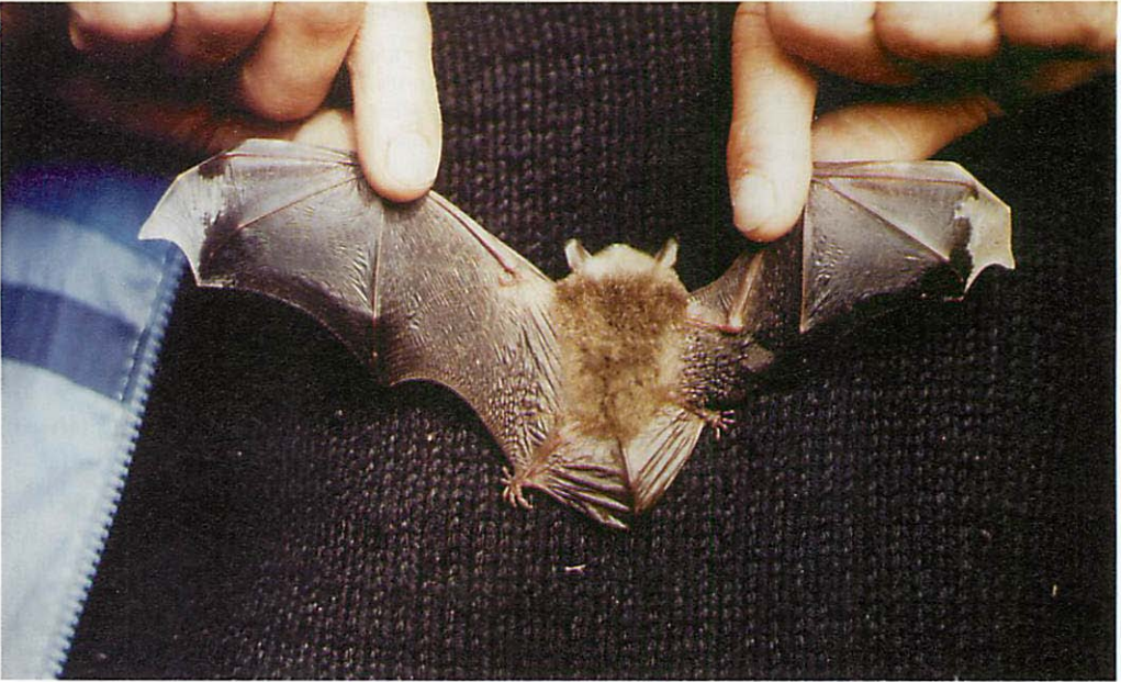
Abb. 1. Partiell-albinotische Fransenfledermaus ( Myotis nattereri ) aus dem Raum Rodewald/Niedersachsen (dorsal).